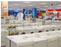
INNOVA Filiale im Forum Steglitz in Berlin.