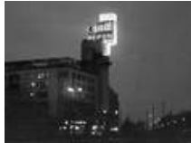
Der historische Contiturm am Theodor-Heuss-Platz in Berlin einst ...