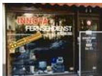
Vor ca 30 Jahren: unser 2. Laden in Neukölln ca. 1983