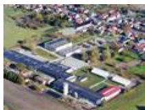
Das INNOVA Zentrallager in Klosterfelde bei Berlin.