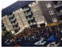
Eröffnung in Spandau ca. 1985