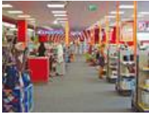
INNOVA Filiale im Forum Steglitz in Berlin.