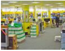
INNOVA Filiale im Forum Steglitz in Berlin.