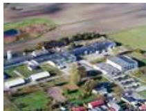
Das INNOVA Zentrallager in Klosterfelde bei Berlin.