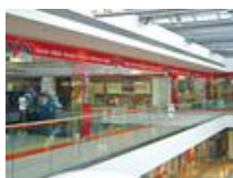
INNOVA Filiale im Forum Steglitz in Berlin.