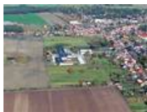
Das INNOVA Zentrallager in Klosterfelde bei Berlin.