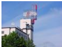
... und heute, rekonstruiert nach Originalvorgaben des Denkmalschutzes.