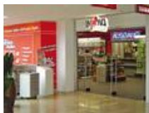
INNOVA Filiale im Forum Steglitz in Berlin.