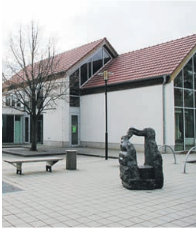
Die Heimatstube Motzen wird seit 2000 als „Museum im Haus des Gastes“ geführt.