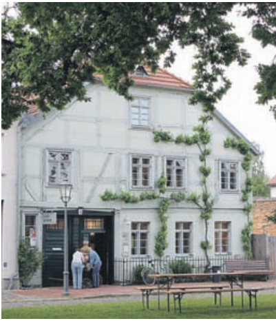
Nachdem das Fachwerkhaus am Salzmarkt 5 in Stand gesetzt wurde, wird es als Museum genutzt.