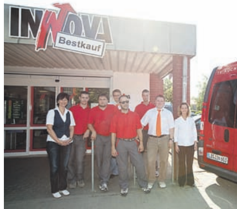
Qualität und eine umfassende Beratung gehören bei Innova zur Geschäftsphilosophie.

Qualität gefertigt und werden durch Fachleute der eigenen Montagetechnik zu den Kunden geliefert, montiert und einschließlich aller Geräte aufgebaut, inzwischen sind es ca. 200 Küchen pro Jahr. „Wir unterbieten fast jeden Preis“ – Eine Kernaussage, auf die sich INNOVA Kunden verlassen können. Das attraktive Preis-Leistungs-Verhältnis und höchste Qualitätsmaßstäbe bei den verkauften Produkten sind die entscheidenden Faktoren für den seit 1990 erfolgreich bestehenden INNOVA Kundenclub mit seinen Vorteilen wie z. B. verlängerte